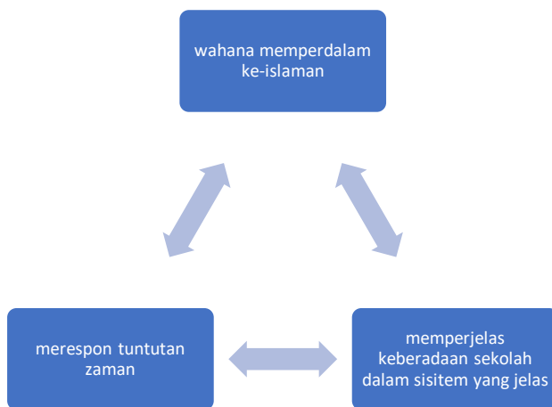
Bagan 3. Solusi arternatif persoalan fundamental.