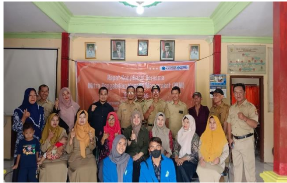
Gambar 5. Rapat koordinasi pelaksanaan PKM di lokasi mitra