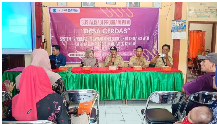
Gambar 6. Sosialisasi Program kepada Masyarakat