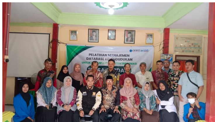
Gambar 7. Pelatihan Manajemen Database Kependudukan