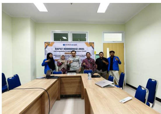
Gambar 3. Rapat koordinasi di UNIMUS

Pada tahap ini dilakukan koordinasi dari Tim untuk menganalisis kebutuhan mitra dan persiapan perancangan sistem.