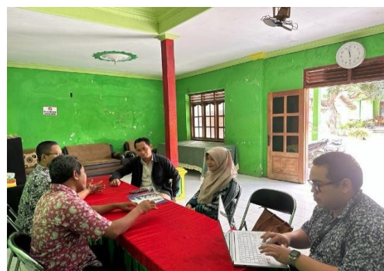
Gambar 4. Diskusi Analisis Kebutuhan di lokasi mitra