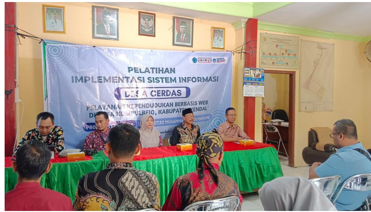
Gambar 8. Pelatihan Manajemen Database Kependudukan