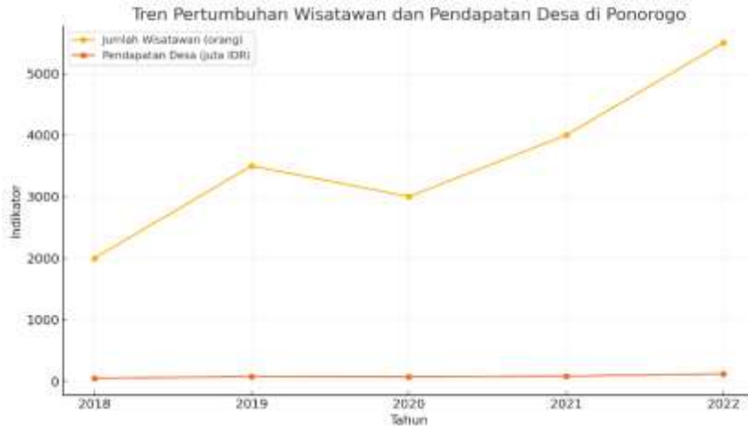
Grafik.1.3: Tren Pertumbuhan Wisatawan dan Pendapatan(Tomaz et al., 2020)

Grafik berikut ini menunjukkan tren pertumbuhan jumlah wisatawan dan pendapatan desa di Ponorogo dari tahun 2018 hingga 2022. Data hipotetis ini memperlihatkan hubungan langsung antara peningkatan kunjungan wisatawan dengan kenaikan pendapatan desa.