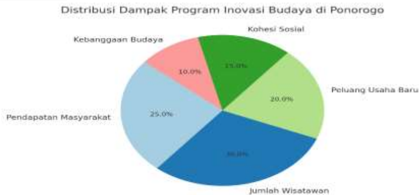
Grafik.1.4: Distribusi Dampak Program(Li & Yan, 2024)

Grafik berikut menunjukkan distribusi dampak program inovasi budaya di Ponorogo berdasarkan berbagai kategori seperti pendapatan masyarakat, jumlah wisatawan, peluang usaha baru, kohesi sosial, dan kebanggaan budaya. Proporsi ini memberikan gambaran bagaimana berbagai aspek berkontribusi terhadap keseluruhan dampak program.