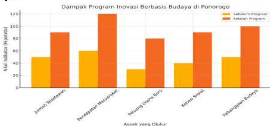
Grafik.1.2: Dampak Program Sebelum dan Sesudah (Li & Yan, 2024)

Sebagai data penguat Berikut Grafik yang menggambarkan dampak program inovasi berbasis budaya di Ponorogo pada berbagai aspek ekonomi dan sosial. Nilai-nilai indikator hipotetis sebelum dan sesudah program menunjukkan peningkatan signifikan dalam jumlah wisatawan, pendapatan masyarakat, peluang usaha baru, kohesi sosial, dan kebanggaan budaya.