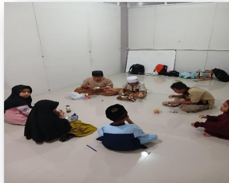
Gambar 3: Kegiatan Makan Bersama