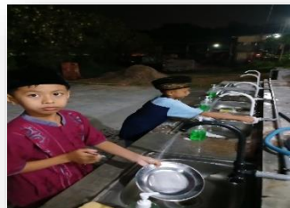
Gambar 4: Anak Sedang Mencuci Piring

Ketiga makan bersama , kegiatan ini dilakukan setelah bersih-bersih yang dilanjutkan dengan makan bersama. Setiap anak diberikan piring dan sendok, dan mereka diminta berbaris rapi mengantri untuk mengambil sendiri nasi dan lauk yang disediakan, Setelah itu, mereka makan bersama dan tak lupa untuk memulai dengan membaca do'a sebelum makan. Dilanjutkan dengan mengajarkan mereka mencuci piring dan sendoknya masing-masing hingga bersih dan meletakkannya pada tempat piring. Hal ini bertujuan supaya terbiasa dengan kemandirian yang dilakukannya di rumah nanti. Berikut ini adalah kegiatan makan bersama dan mencuci piring setelah makan.