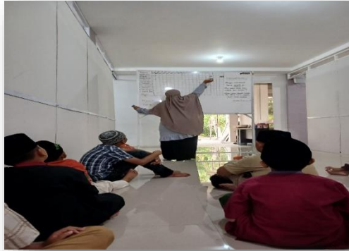
Gambar 1: Program Mutaba'ah di Kelas