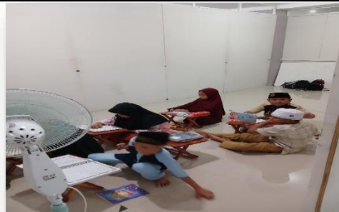
Gambar 6: Kegiatan Mengaji

Pembiasaan akhlak anak sangat penting untuk ditanamkan sejak mereka di usia dini. Alasannya adalah supaya perbuatan atau adab yang baik yang diajarkan dapat dibiasakan untuk diterapkan dalam kehidupan sehari-harinya. Hal ini perlu ditekankan karena akhlak yang baik akan membawa mereka kepada teladan yang baik, baik terhadap kedua orang tua mereka maupun terhadap orang yang dianggap lebih tua dari mereka. Salah satunya adalah membiasakan melakukan adab-adab yang baik (seperti: bertutur kata yang baik, bersalaman ketika bertemu, sopan santun kepada yang lebih tua dan lain sebagainya).