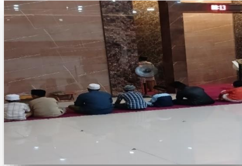
Gambar 5: Sholat Maghrib dan Dzikir Berjama'ah

pembiasaan adab/akhlak yang mulia terhadap orang tua. Kegiatan keempat ini bertujuan untuk membiasakan anak dalam melakukan ibadah secara berjama'ah dan tidak lupa untuk meningkatkan kualitas dalam beribadah sebagai bekal kelak mereka ketika sudah dewasa terbiasa melakukan ibadah dengan niat karena Allah ta'ala. Berikut merupakan bentuk rangkaian kegiatan ibadah berjama'ah: