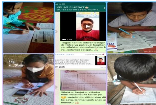
Gambar: Pembelajaran (Daring) SDN 4 Kreet Jambon Ponorogo

Video Call merupakan panggilan video yang tujuannya dapat berkomunikasi melalui tatap muka secara langsung tanpa kehadirannya dengan penerima menggunakan gadget.