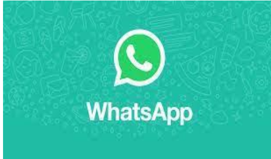
Gambar: Aplikasi yang di Gunakan dalam Berkomunikasi

Whatsapp merupakan aplikasi yang digunakan sebagian besar penduduk terutama siswa salah satunya adalah sebagian sarana untuk komunikasi dan sebagai pembelajaran dalam jaringan, sehingga dapat memenuhi segala bentuk tugas dari sekolah guna pelaksanaan pendidikan dapat berjalan dengan lancar.