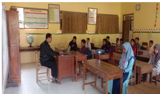
Gambar: Pembelajaran (Luring) SDN 4 Kreet Jambon Ponorogo

Daring merupakan pembelajaran dalam jaringan yang dilakukan oleh pihak sekolah seperti gambar di atas, kegiatan pembelajaran tetap berjalan walaupun masing-masing siswa berada di rumah. Sehingga dapat memenuhi tujuan pembelajaran.