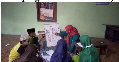
Gambar 5 Kegiatan Pendampingan dalam Pembelajaran Tajwid

Pendampingan Pembelajaran ilmu Tajwid ini dilakukan setiap selesai melakukan kegiatan pembelajaran mengaji Al-qur'an. Tim pengabdian masyarakat melakukan pendampingan pembelajaran ilmu tajwid dengan cara menulis materi ilmu tajwid di whiteboard. Setelah selesai menulis, tim pengabdian masyarakat melakukan penjelasan. Setelah adanya penjelasan mengenai materi ilmu tajwid diadakan permainan cepat-cepatan untuk mencari contoh dari penjelasan materi dalam Al-qur'an. Santriwan-santriwati yang bisa mendapatkan contoh lebih awal atau cepat akan mendapat point. Point ini di kumpulkan oleh anak-anak dan bisa ditukarkan hadiah jika sudah banyak pointnya. Dengan target yang diharapkan santriwan-santriwati mendapatkan 100 point untuk bisa ditukarkan dalam bentuk hadiah. Dimana setiap tercepat mendapatkan contoh tercepat akan