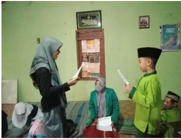
Gambar 4 Kegiatan permainan bahasa arab

Kegiatan di TPA terbagi menjadi dua yaitu kegiatan pokok dan kegiatan penunjang. Kegiatan pokoknya yaitu kegiatan mengaji alquran dan kegiatan penunjangnya adalah materi seperti bahasa arab, tarikh , sirah , fikih, dan sebagainya disesuaikan dengan kondisi masyarakat. 10 Kegiatan penunjang yang dipilih dalam program kegiatan mengadakan