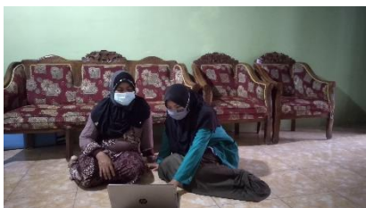
Gambar 1 Sosialisasi dengan Ustadzah

Kelompok Pengabdian yang ada di TPA Al-Amin merupakan pengkader pengajar yang ada di TPA Al-Amin dengan memiliki tujuan agar para ustadzah bisa melakukan pengajaran yang inovatif. Karena taman pendidikan Al-qur'an bertujuan untuk menyiapkan anak didiknya agar menjadi generasi yang Qur'ani. 8 Guru mengaji atau ustadzah mempunyai dampak yang banyak atau paling penting dalam sebuah pendidikan. Perang penting yang dimiliki seorang ustadzah atau guru ngaji adalah ikhlas dalam memberikan