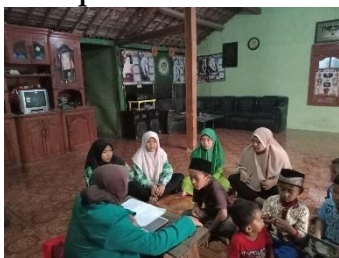
Gambar 2 kegiatan Estafet Surat

Kegiatan estafet surat ini dilakukan dengan cara pilihan surat ditentukan oleh pengajar. Para santriwan-santriwati ditunjuk untuk melanjutkan atau menyambung potongan ayat yang disebutkan oleh pengajar. Estafet surat ini diharapkan mampu memberikan motivasi yang baik untuk menghafal surat-surat pendek dalam Al-qur'an lebih cepat, mudah dan tidak bosan untuk para santriwan-santriwati. Santriwan-santriwati menyambut permainan estafet surat pendek ini dengan senang hati dan bergembira.