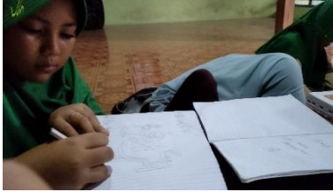
Gambar 3 kegiatan membuat Kaligrafi dan bermain imajinasi warna