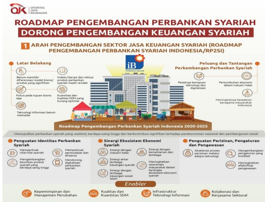
Gambar 1.2 Roadmap Pengembangan Perbankan Syariah.(Suhendra, Asworowati, & Ismawati, 2020)

Di samping itu, saat ini kita sedang dihadapkan oleh kondisi global yang telah memaksa kita untuk masuk ke dalam era New Normal sebagai dampak dari pandemi global Covid-19. Era normal pasca pandemi ini telah membuat pola kehidupan sosial, masyarakat, dan ekonomi mengalami perubahan dengan semakin meningkatnya kewaspadaan yang mengharuskan menjaga jarak fisik dalam berinteraksi. Namun di sisi lain, kepedulian dalam membantu sesama semakin meningkat terutama dalam permasalahan ekonomi. Hal ini menjadi tantangan sekaligus peluang bagi perbankan syariah untuk dapat memberikan pelayanan berbasis digital serta memenuhi kebutuhan sosial masyarakat sehingga dapat berperan dalam membangun perekonomian umat pasca pandemi.(Suhendra et al., 2020)