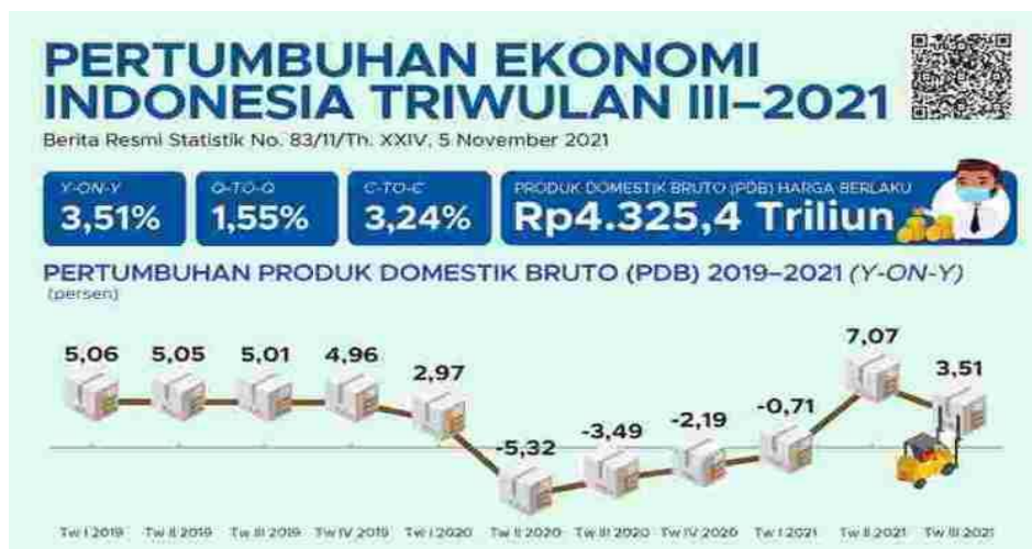
Gambar 1.2), Perekonomian Indonesia tetap tumbuh positif pada triwulan III 2021

Ekonomi Indonesia pada triwulan III 2021 tumbuh sebesar 3,51%, lebih rendah dari capaian triwulan sebelumnya sebesar 7,07%. Perkembangan tersebut terutama ditopang oleh kinerja ekspor sejalan dengan tetap kuatnya permintaan mitra dagang utama. Ekonomi Indonesia triwulan III-2021 terhadap triwulan sebelumnya mengalami pertumbuhan sebesar 1,55 persen.