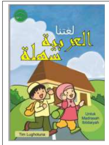
(salah satu modul pembelajaran yang dibuat oleh tim)

Jadi setelah peneliti melihat dari teori tentang perencanaan yang sudah ada, maka kegiatan CIBI sudah sesuai dengan perencanaan karena beberapa kegiatan yang akan dilaksanakan itu berdasarkan pada hasil musyawarah. Begitu juga proses perencanaan dipikirkan secara matang. Dan tidak ketinggalan juga merencanakan hasil yang ingin dicapai dari matrikulasi tersebut diantaranya menguasai mufrodad dan mampu mengucapkan dan bisa menggunakannya dalam kegiatan berbahasa.